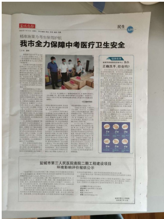
图 3.2-2-1（2020 年 7 月 14 日登报公示照片）