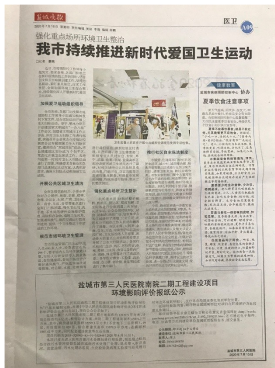
图 3.2-2-2（2020 年 7 月 16 日登报公示照片）

盐城晚报属于盐城市公众易于接触的报纸，本项目在征求意见的 10 个工作日内公开信息不少于 2 次，因此符合《环境影响评价公众参与办法》