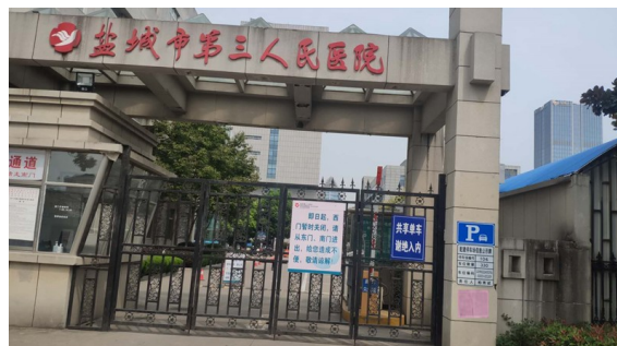
第三人民医院西大门，二期工程东侧