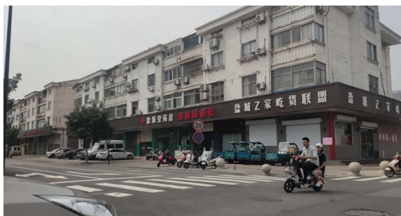
二期工程北侧娱乐社区

我院于 2020 年 7 月 8 日~2020 年 7 月 23 日（10 个工作日）分别在盐城市第三人民医院在大门口、娱乐社区小区外张贴公告，张贴公示照片见下图 3.2-3。