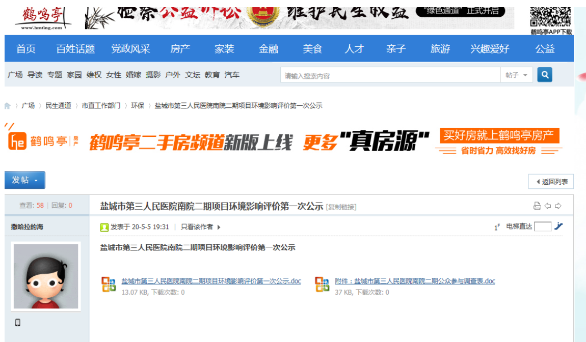
图 2.3-1 项目环境影响评价第一次网上公示截图

( http://www.hmtng.com/forum.php?mod=viewthread&tid=15375906&highlight=%D1%CE%B3%C7%CA%D0%B5%DA%C8%FD%C8%CB%C3%F1%D2%BD%D4%BA )，网站公示截图见图 2.3-1。